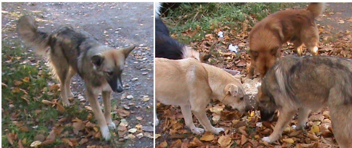
Fler av hundarna från kvinnans hem