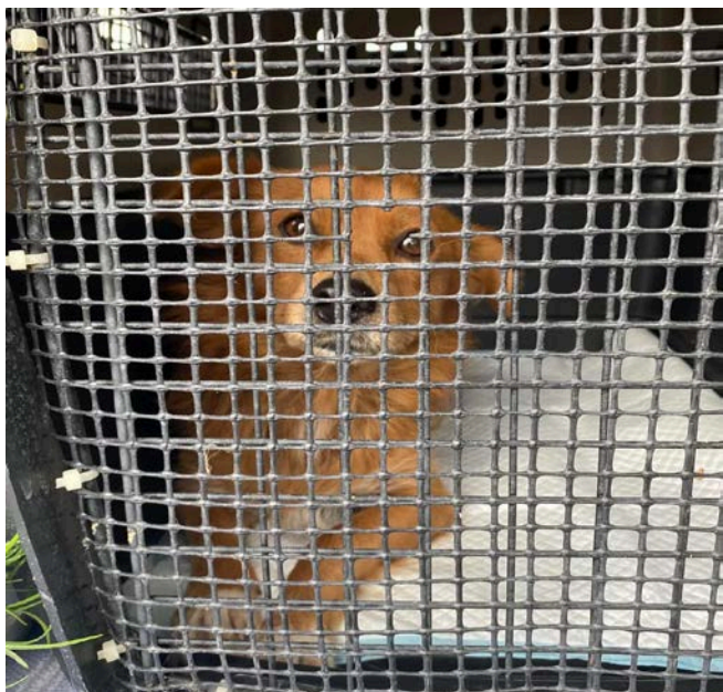
En liten söt hund full av loppor och löss som vi plockade upp på vägen.