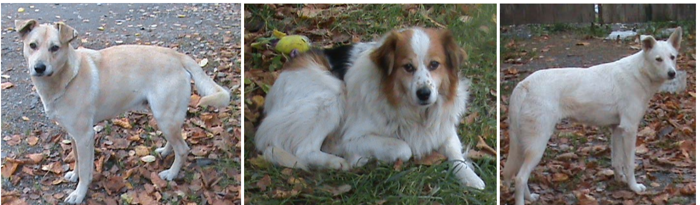
Några av hundarna som Elena hittade hos kvinnan

En kvinna som nyligen avled hade 8 hundar och 14 katter hemma. Elena åkte dit för att se hur många hon kunde hjälpa, men de hittade bara 6 hundar och 1 katt. Katten som fick namnet Maxim fick följa med och hon är nu kastrerad. Elena försökte omplacera hundarna, men i nuläget är det svårt – ingen vet hur framtiden ser ut, så ingen vågar ta emot en hund. Då fick de följa med Elena hem för kvinnan hade inga arvingar.