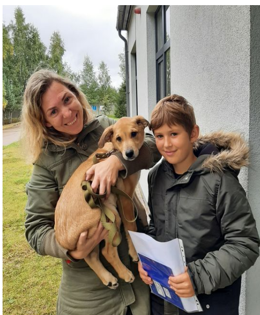
En lycklig valp, som blivit adopterad och fått ett nytt hem