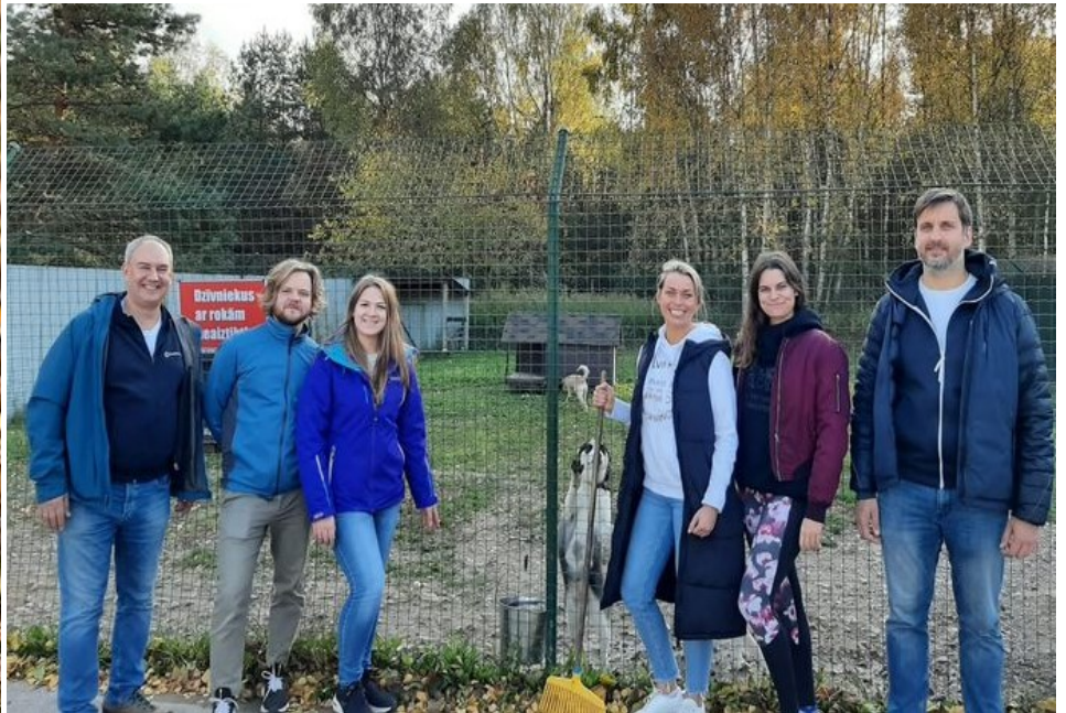
Volontärerna på djurhemmet, här är sex av dem, är oundgängliga för att verksamheten ska fungera.