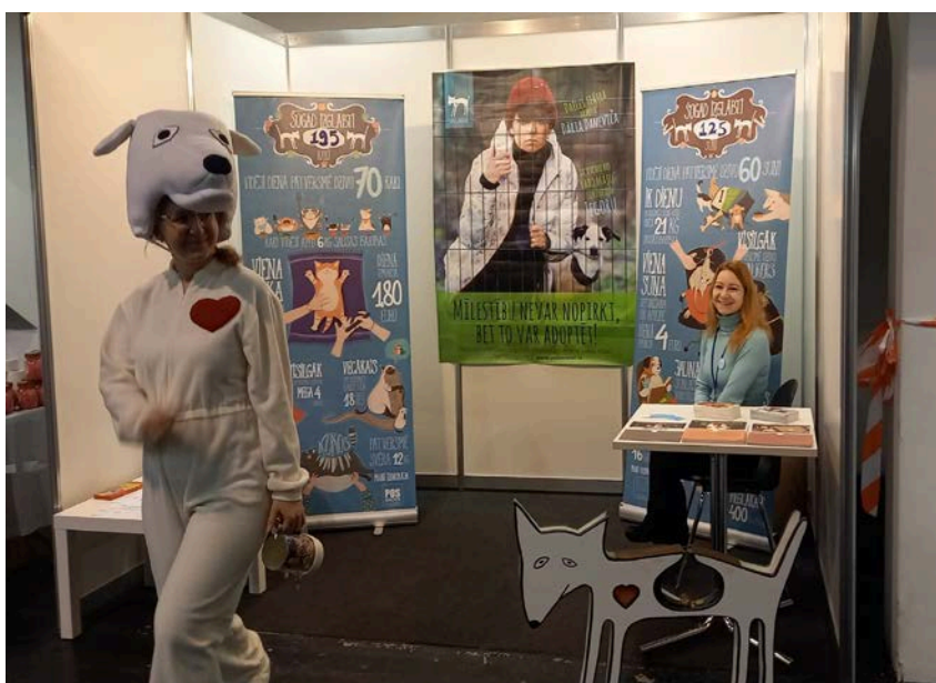
Våra lettiska vänner satsar stort på att nå ut med information om djurhemmet, här under mässan Zoexpo Latvia 2022