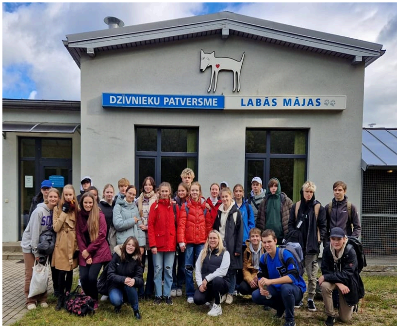
En av många skolklasser som har kommit på studiebesök och träffat alla djuren på djurhemmet.